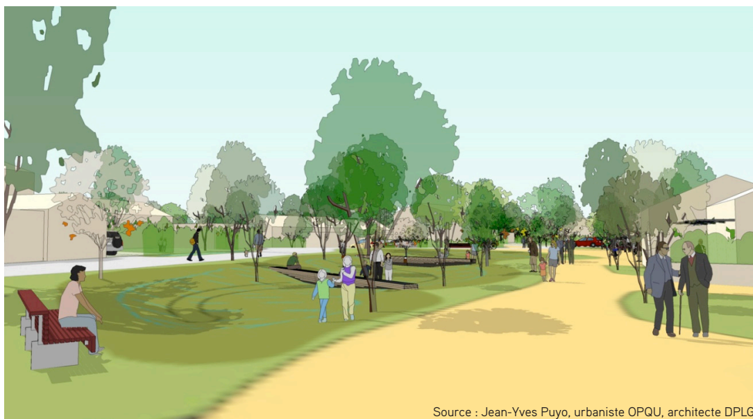
Le chemin des Noues : amorce du cheminement piétons