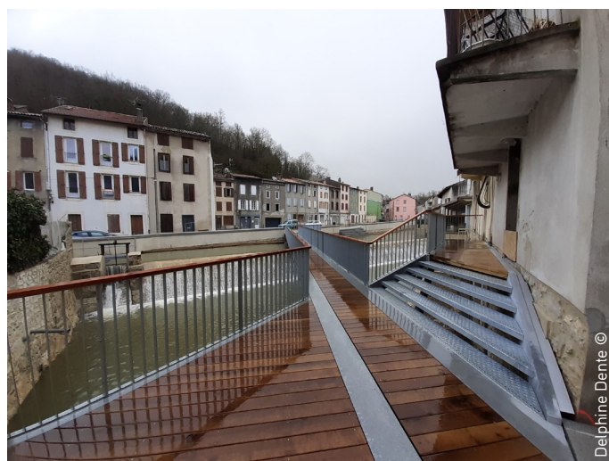
Delphine Dente ©

Vous voulez en savoir plus ? Contactez le commanditaire du projet